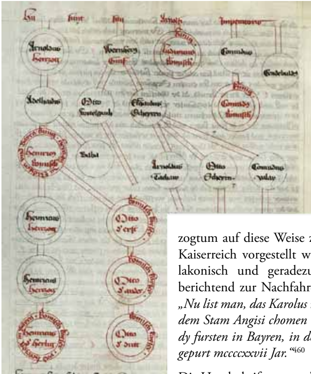
Die Wittelsbacher als Nachfahren der Karolinger. Andreas v. Regensburg, Cronik von den Fürsten zu Bayern . UB Heidelberg, Cpg 96, f. 10v.

einen habe Bayern seinen Namen, nach dem anderen Norigkaw . 458 In der Zeit des Kaisers Octavian, als Christus geboren wurde, beginnt dann die Ahnenreihe mit den Herzögen Boamundus und Ingrammus. 459 Nachdem das Herzogtum auf diese Weise zeitgleich mit dem römischen Kaiserreich vorgestellt wurde, leitet der Chronist fast lakonisch und geradezu eine Selbstverständlichkeit berichtend zur Nachfahrenschaft der Karolinger über: