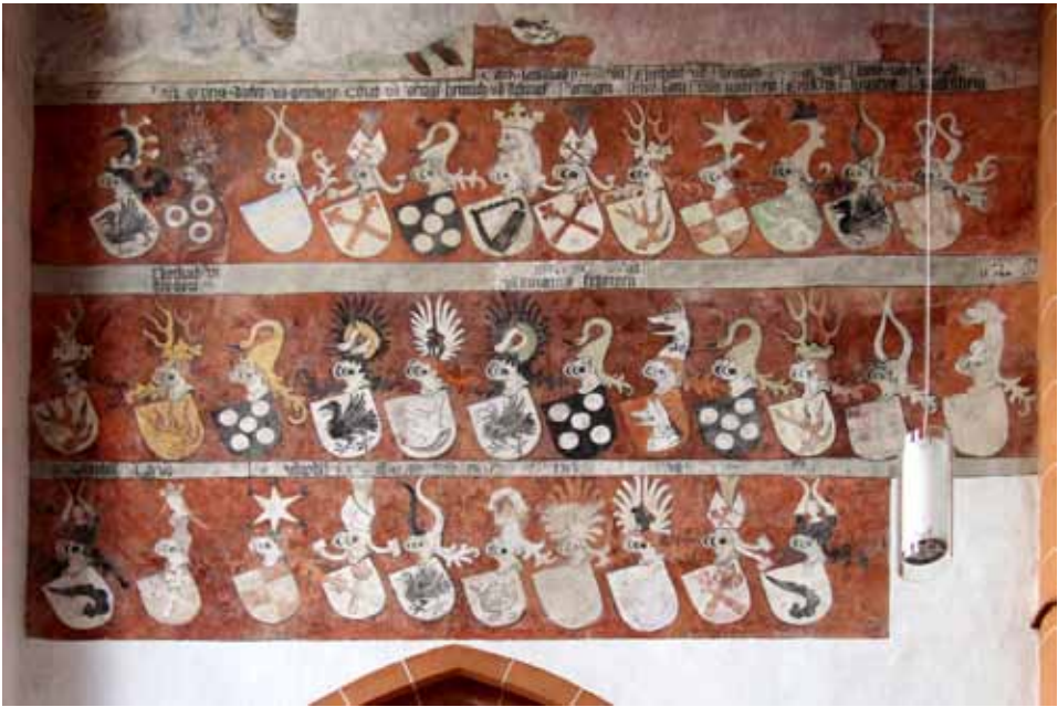
Wappenfries des Kraichgauer Ritterbunds „Zum Esel“ in der Heiliggeistkirche Heidelberg.

im Leydhundt am Krantz sowie die fränkischen Gesellschaften im Bären und deß Einhorn . 616