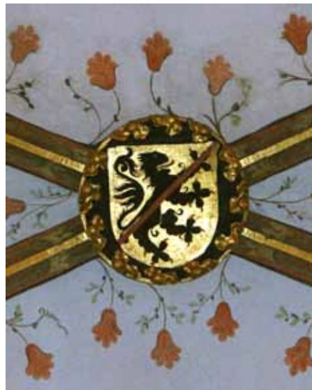
Wappen der Grafen von Namur, 1. Hälfte 15. Jh., Stiftskirche Neustadt an der Weinstraße.

Es fehlt noch Beatrix von Berg, die zweite Gemahlin des Pfalzgrafen und Kurfürsten Ruprecht I. Der war 51, als er Elisabeth von Namur heiratete, er war 73, als diese starb. Er war 76, als er 1385 ein zweites Mal heiratete. Die Auserwählte Beatrix war 25 – und die Tochter seiner eigenen Großnichte Anna, der Tochter seines Neffen Ruprecht II. Welches politische Kalkül stand hinter dieser doch zumindest seltsamen Verbindung? Ob er noch auf Kinder hoffte, bleibt wenigstens zweifelhaft – Kinder aus dieser Ehe hätten das Erbe seines Großneffen Ruprecht III. geschmä-