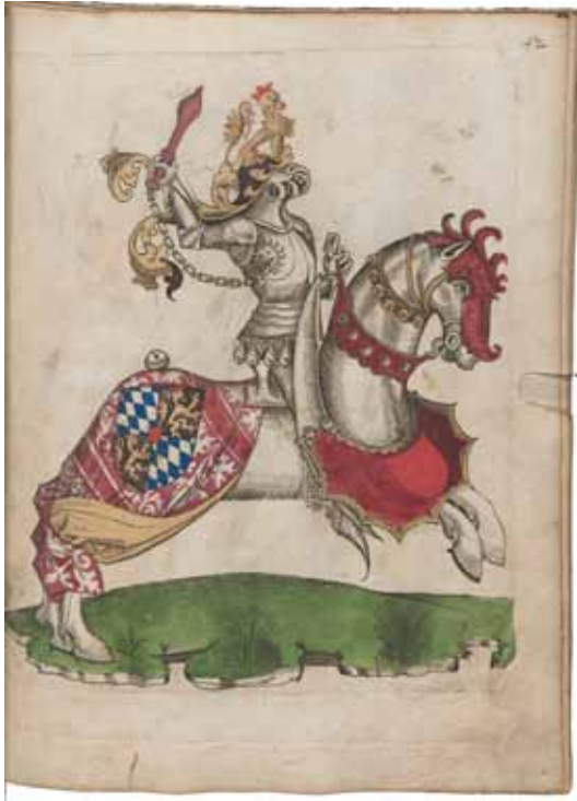
Der Kurfürst Pfalzgraf („de palst graue“) im „Stammbaum“ des Pfalzgrafen Philipp von 1481. Wien, Österreichische Nationalbibliothek, Cod. 2899, f. 42r (online S. 91). Mit der Darstellung ist möglicherweise Philipp selbst gemeint, möglicherweise aber auch nur der „Archetypus“ des rheinischen Pfalzgrafen.

stellten. Mit Bayern-Landshut als „Netzwerkpartner“ wird das weitergeführt: Von Philipps Kindern tragen Georg, *1485, und Heinrich, *1487, Namen aus der Landshuter Tradition, während Georg von Landshut seinen zweiten Sohn, *1477, Ruprecht nennt. Mit dem jüngsten Sohn Philipps, dem 1496 im Kindbett verstorbenen Otto Heinrich wird dann symbolisch die älteste Wittelsbacher Tradition (Otto) mit der Landshuter Tradition (Heinrich) beschworen. Damit wird Otto Heinrich / Ottheinrich als Name in die Pfälzer Großfamilie eingeführt.