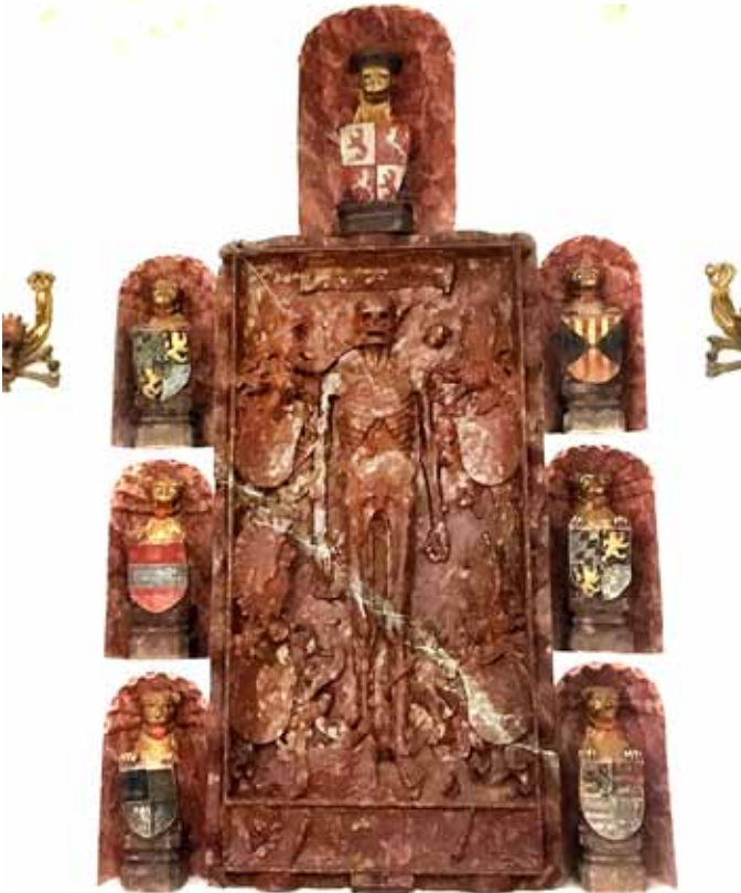
Epitaph des Pfalzgrafen Johann von Pfalz- Mosbach, *1443, +1486, Dompropst in Regensburg und Augsburg, in der ehem. Klosterkirche Reichenbach (Oberpfalz).