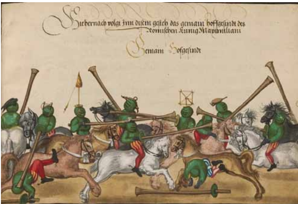
„Hie hernach folgt in dem gesteh das gemain hoffgesindt des Romischen Kunig Maximilian / Gemein Hoffgesindt“ (1498). Turnierbuch Ritterspiele , BSB München, Cod. icon. 398, Image 00057.

Pfalzgraf Friedrich, der spätere Kurfürst Friedrich II., glänzte in den Turnieren durch eine seltene Körperbeherrschung, die er zu Pferd zeigte.