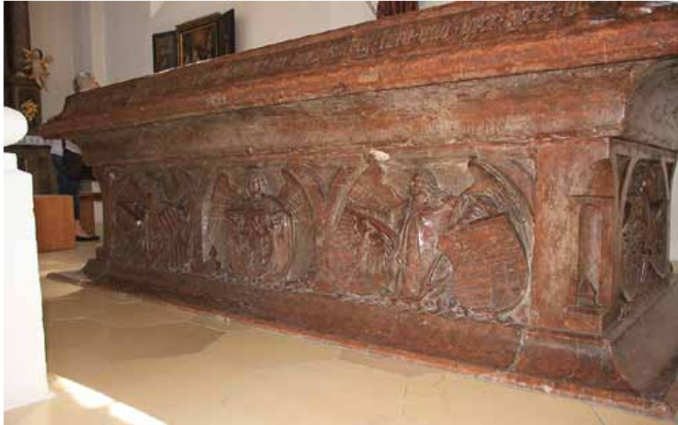
Tumba des Pfalzgrafen Otto II., Schlosskirche Neumarkt. Wappen Österreichs, Siziliens, der Burggrafschaft Nürnberg sowie Schlesiens und Ungarns an der nördlichen Langseite.

Schließlich und endlich können die Autoren des 16. Jahrhunderts ganz lapidar feststellen, dass die Pfalzgrafen dieser Herkunft seien: Comites Palatini Reni oriundi à Carolo magno filio Pipini, Regis Francorum . 468 Dass diese Konstruktion der Herkunft auch im sozialen Umfeld der Pfalzgrafen und Kurfürsten rückhaltlos akzeptiert wurde, zeigt z. B.