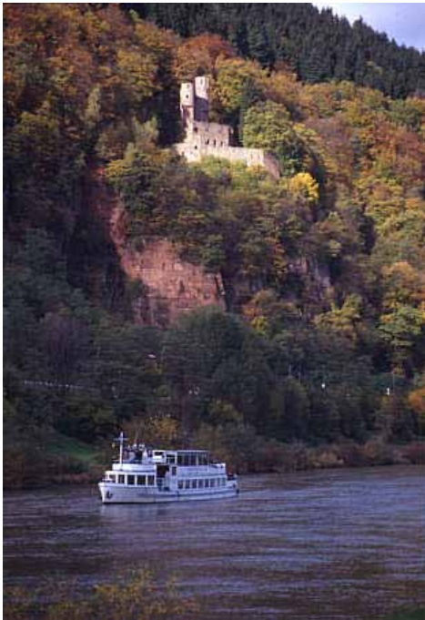
Burg Schadeck („Schwalbennest“) bei Neckarsteinach

Sie stellten die lokale ausführende Gewalt dar. Damit war der Heidelberger Hof eine Plattform, auf der sich der Niederadel der Region traf und aus dem er auch sein Selbstverständnis bezog. Mit dem hohen Rang des Pfalzgrafen stieg auch das soziale Ansehen des Niederadels, der so zum „Hofadel“ wurde.