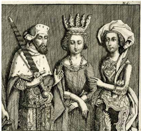
Ludwig III., genannt der Bärtige (1378 - 1436) mit seinen beiden Gemahlinnen Blanka von England (1392 - 1409) und Mechthild von Savoyen-Piemont (1390 - 1438).

Mit dieser Ehe ist Ludwigs IV. Sohn Philipp 438 (und das gilt dann