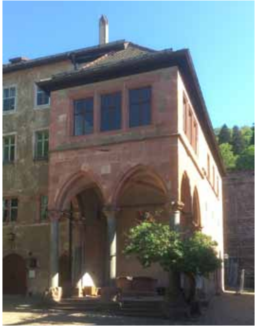
Schlosshof Heidelberg: Brunnenhalle mit Säulen aus der karolingischen Pfalz in Ingelheim.

Für ihn hat das Pfalzgrafenamnt seinen Ursprung in der Zeit Pippins und des großen Karl und erste Besitzschwerpunkte im unmittelbaren Kreis der Karolinger. Es scheint, dass die karolingische Abstammung als Tatsache feststeht und keiner großen Worte bedarf: „Hat demnach niemand daran zu zweiffeln / als man mit Bestellung der Churfürsten umgangen