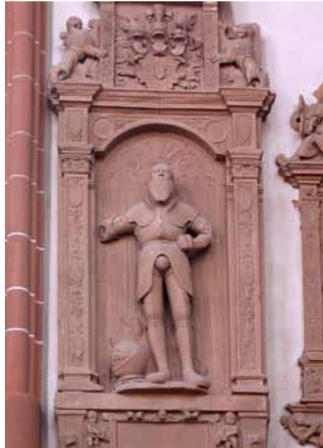
Epitaph des Grafen Philipp III. von Hanau-Münzenberg in der Marienkirche Hanau, des Bräutigams von 1551.

Gastgeber waren natürlich Kurfürst Friedrich II. und seine Gemahlin Dorothea, die Gästeliste nennt weiter die Brüder des Kurfürsten Heinrich, Bischof von Worms, und Wolfgang, dann Johann II. und seinen Sohn Friedrich von Pfalz-Simmern, 494 Ottheinrich von Pfalz-Neuburg, Wolfgang von Pfalz-Zweibrücken, die badi-schen Markgrafen Bernhard und Philibert, Graf Ludwig v. Stolberg, Königstein und Ruschenfort, 495 Graf Johannes von Veda, Herrn von Runkel und Eisenburg, 496 Graf Mi-