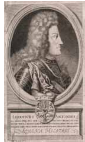
Ludwig Anton von Pfalz-Neuburg, Bischof von Worms.

Ludwig Anton, Bruder des Vorigen (1660 - 1694), 1664 Domherr in Köln, 1668 in Mainz, 1669 in Straßburg, 1673 Abt von Fécamp in der Normandie, 1674 Domherr in Speier, 1675 in Münster und 1678 in Lüttich, 1679 Deutschordens-Ritter und 1681 Koadjutor des Hoch- und Deutschmeisters, 1685 Hoch- und Deutschmeister sowie Administrator des Hochmeistertums in Preussen, 1689 Propst in Ellwangen, 1691 Koadjutor des Erzstifts Mainz und im selben Jahr Bischof von Worms. Priesterweihe 1693.