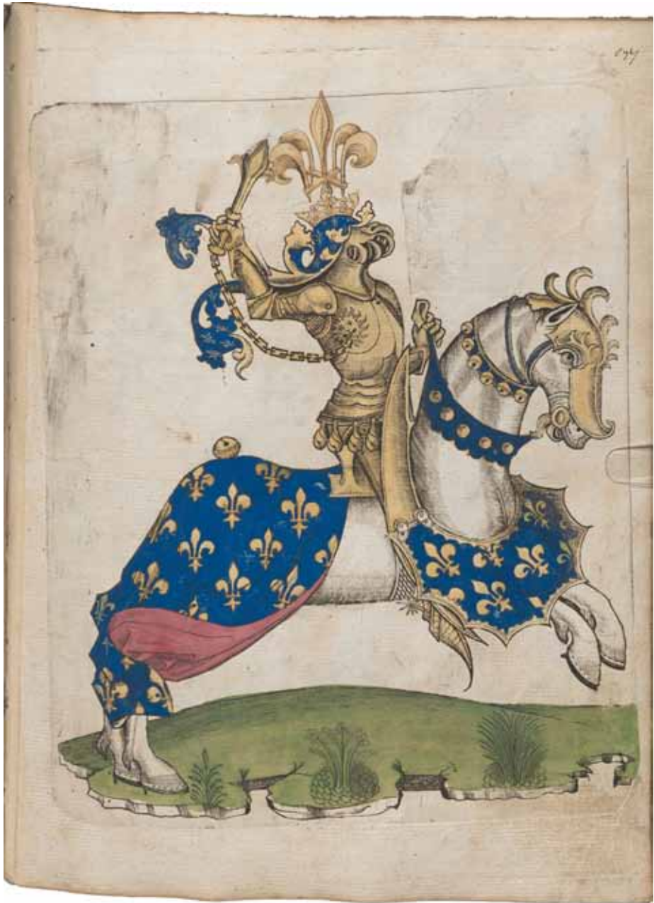
Wappenreiter in den Farben des Königreichs Frankreich aus dem Stammbaum des Pfalzgrafen Philipp des Aufrichtigen, 1481. Wien, Österreichische Nationalbibliothek, Cod. 2899, fol. 37r (online S. 81).