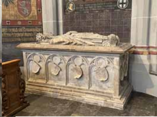
Grabmal des Kölner Erzbischofs und Kurfürsten Ruprecht, des Sohnes des pfälzischen Kurfürsten Ludwig III., + 1480, in der Kirche des St. Cassius-Stifts in Bonn (heute Bonner Münster).