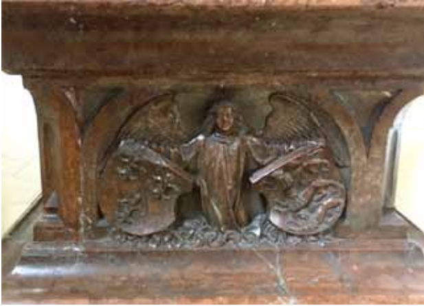
Tumba des Pfalzgrafen Otto II. von Pfalz-Mosbach († 1499), Schlosskirche Neumarkt. Wappen von Frankreich und England an der östlichen